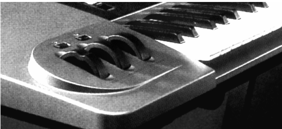
Figura 8.2. Detalle de un teclado, con las ruedas de modulación y de pitch bend.

La magnitud de la desafinación producida por el Pitch Bend suele ser ajustable para cada sintetizador. El General MIDI establece que, por defecto, el rango de desafinación debe ser de +/- 2 semitonos.